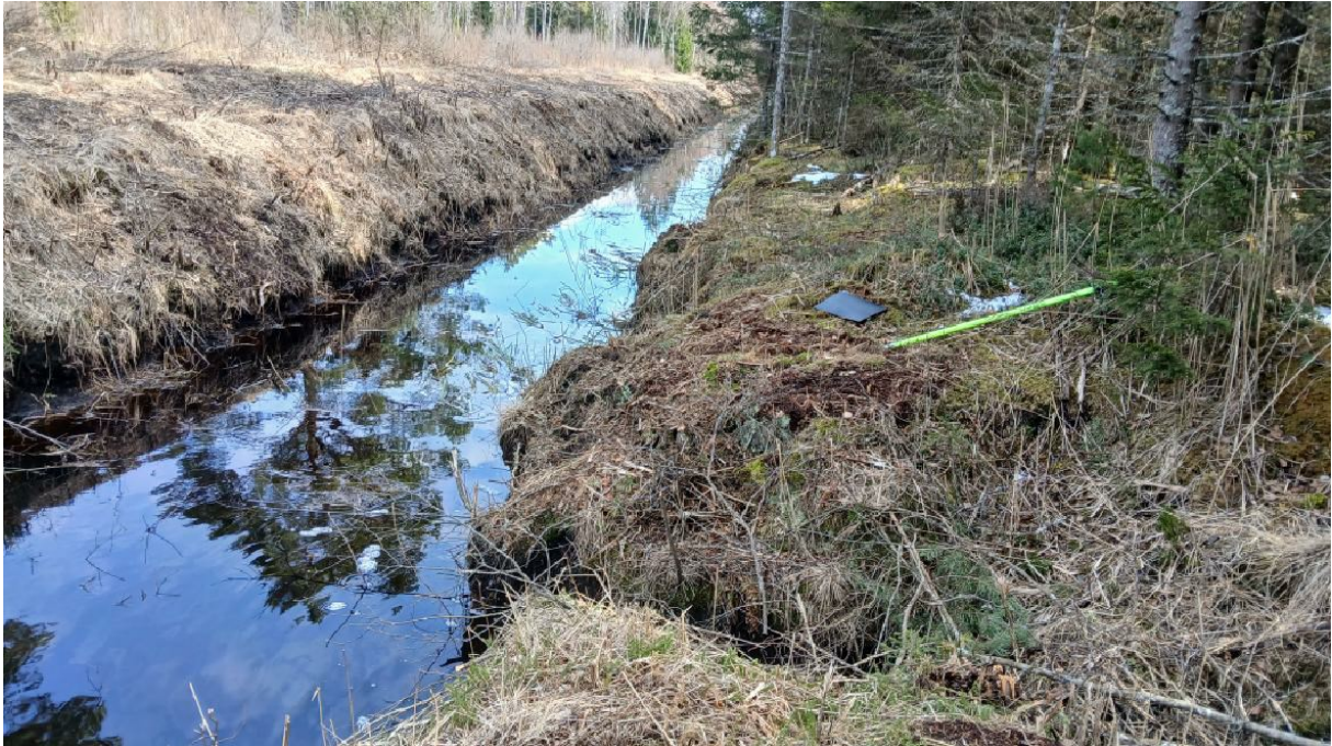
Foto 7. Eesvool 300 kraavi 301 suubumise asukohas (27.05.2023)

Täiendavalt uuriti vastavalt Lääne-Nigula valla Martna Osavallavalitsuse soovile kuivenduskraavi, mis asub katastritunnusel Kullamaa metskond 83 45203:001:0157.