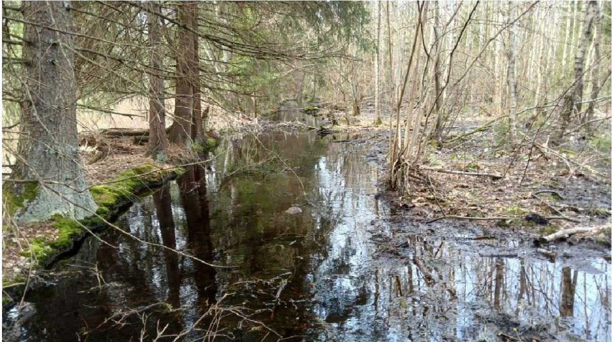
Foto 8. Uuritud kuivenduskraav katastriüksusel Kullamaa metskond 83 45203:001:0157

2024 aasta aprilli kuus viidi läbi täiendavad uurimised PTA projekteerimistingimuste põhjal, et hinnata eesvoolul 200 asuvaid drenaažisuudmeid. Kokku uuriti 7 drenaažisuuet, mille iseloomustused on järgnevad: