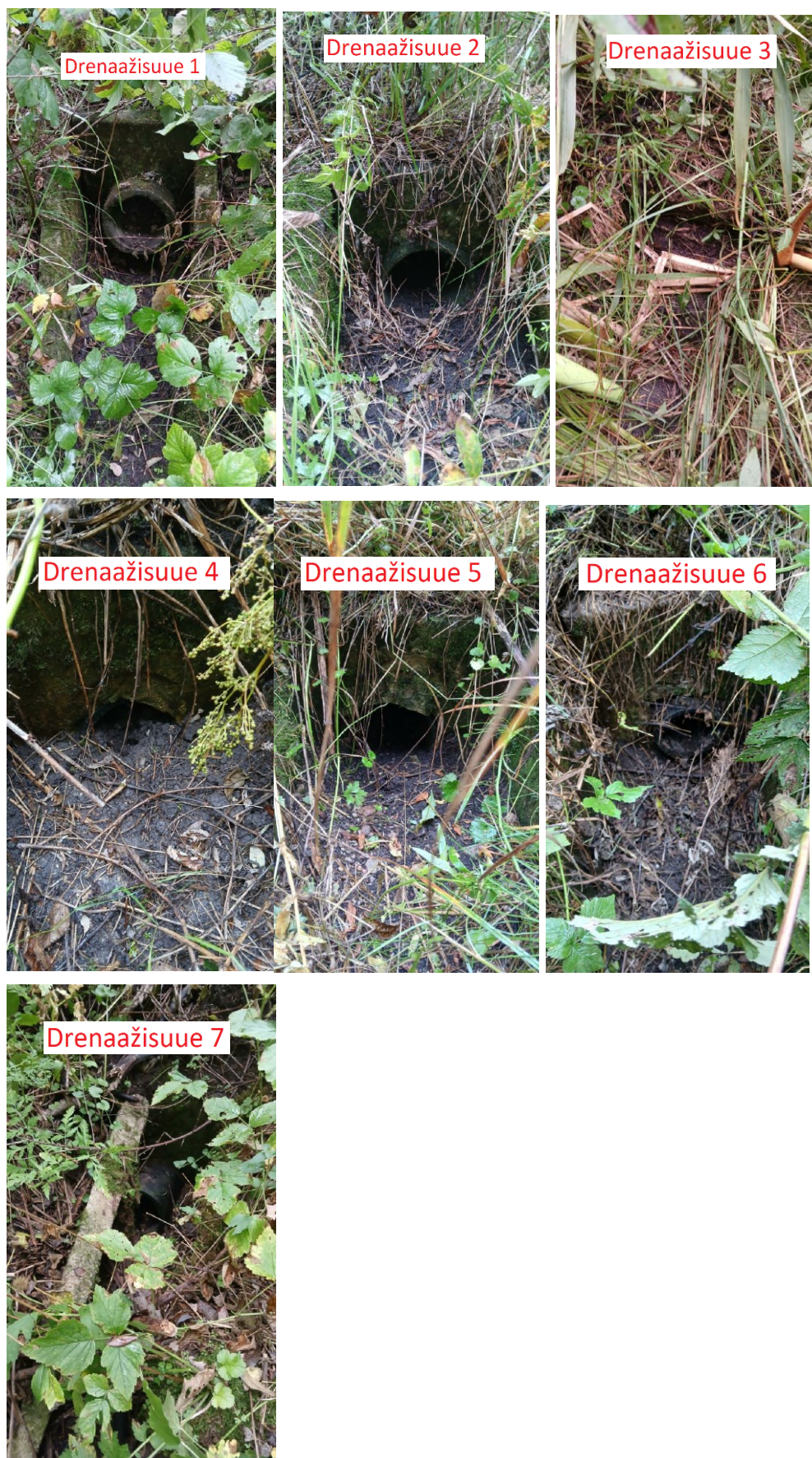
Fotod 9. Uuritud drenaažisuudmed (22.08.2024)