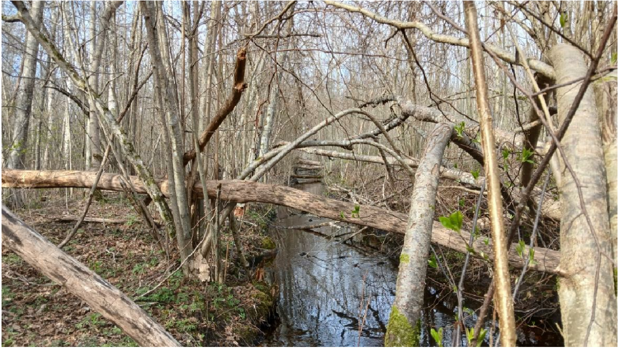
Foto 1. Eesvool 100 kvartalil HS422 eraldisel 16 vaatega ülesvoolu (27.05.2023)

Alates ristumisest kraaviga 104 muutub eesvoolu 100 seisukord selliseks, kus veejuhe sisuliselt puudub. Kvartalil HS116 eraldisel 7 ristub eesvool 100 õhuelektriliiniga. Antud piirkonnas veejuhe puudub täielikult. Uurimistööde ajal oli maapind üle ujutatud ja liigniiske.