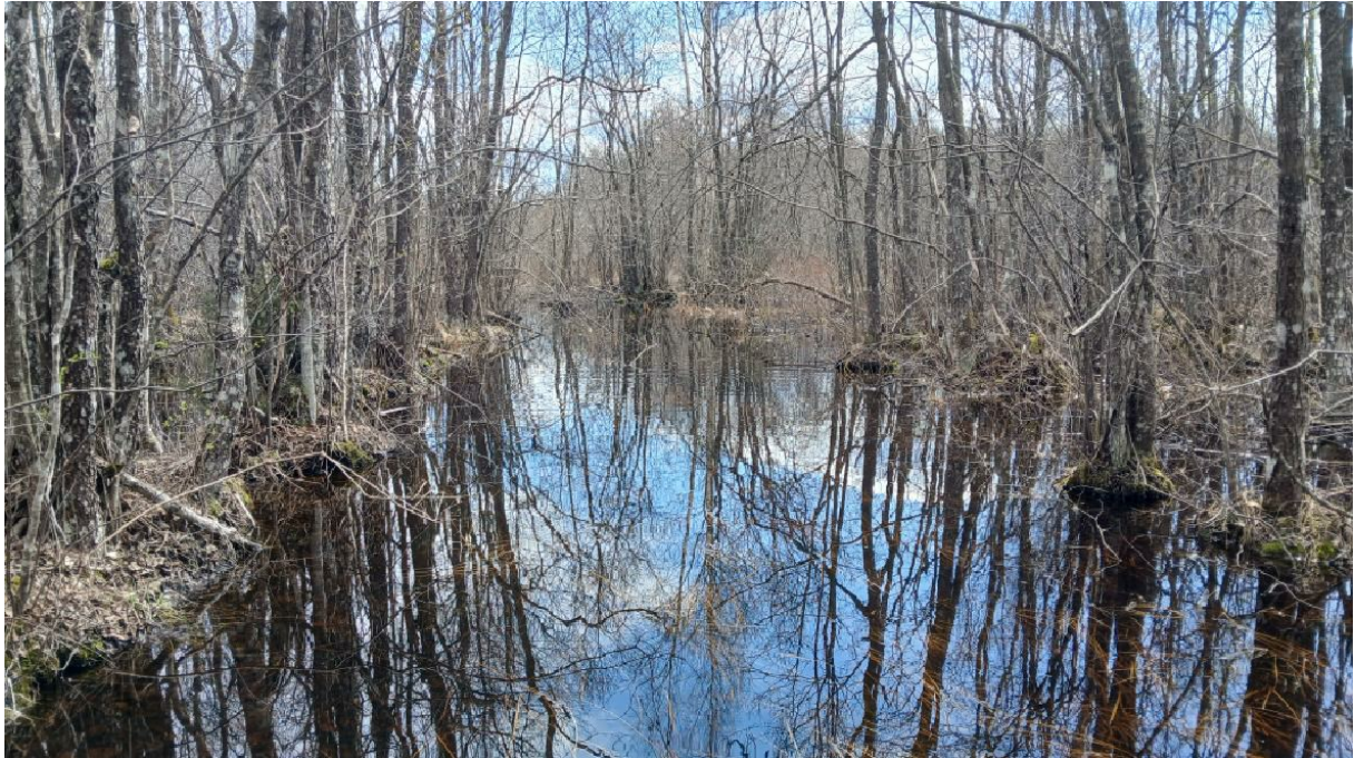
Foto 3. Eesvool 100 kvartalil HS421 eraldisel 2 vaatega allavoolu (27.05.2023)

Ehitisel 1 olevad kuivenduskraavid on amortiseerunud – täis settinud ja voolusängis kasvab puittaimestik. Sarnaselt eesvooluga 100 on kraavi 104 äravool puudulik. Uurimistööde ajal oli kohati veepind kõrgemal ümbritsevast maapinnast.