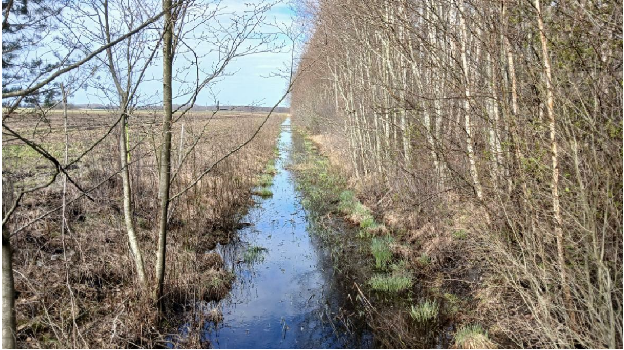
Foto 4. Eesvool 400 vaatega truubist T2 ülesvoolu (27.05.2023)

Alates truubist T2 kuni lõpuni asub eesvoolus lõunapool põld ja eesvoolu suubuvad drenaažisuudmed (6 tk). Uurimistöödega fikseeritud drenaažisuudmed on esitatud joonisel 1. Drenaažisuudmete seisukorda uurimistöödega ei määratud. Eesvoolu mullavall asub veejuhtmes põhja pool RMK maal, kuid mullavallil kasvab puittaimestik.