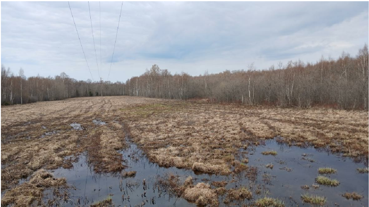
Foto 2. Eesvool 100 kvartalil ristumisel õhuelektriliiniga (27.05.2023)

Alates ristumisest kraaviga 104 muutub eesvoolu 100 seisukord selliseks, kus veejuhe sisuliselt puudub. Kvartalil HS116 eraldisel 7 ristub eesvool 100 õhuelektriliiniga. Antud piirkonnas veejuhe puudub täielikult. Uurimistööde ajal oli maapind üle ujutatud ja liigniiske.